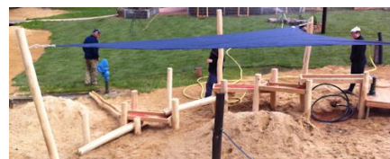
Der neue Wasserspielplatz ist bald fertig