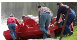
Auch das Tretboot muss wieder ins Wasser

Dank eurer kräftigen Hilfe haben wir in den vergangenen Wochen schon sehr viel geschafft. Damit die Saison 2014 pünktlich zu Himmelfahrt am 29.05. beginnen kann, brauchen wir zu einem weiteren