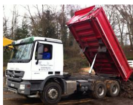
Schweres Gerät im Einsatz

Eingangsbereich / Pflasterungen: Der Eingangsbereich wurde ansprechender gestaltet und die Außenduschen wurden überarbeitet. Die Badehaus-Fassade im Eingangsbereich wird noch neu verschalt.