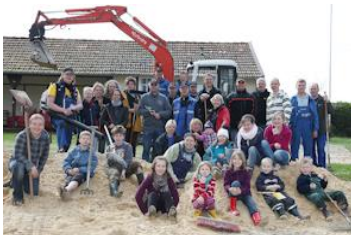
Wir brauchen wieder kräftige Unterstützung

Volleyballfeld / Liegewiese: Das Volleyballfeld wurde nun vollständig in die Liegewiese im Familienbereich integriert. Die Liegewiese wurde völlig neu gestaltet.