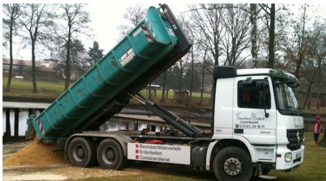
Der Strand wurde schon im März wieder hergerichtet.

Darum brauchen wir am 12. Mai, ab 8.30 Uhr ganz viele fleißige Helfer am Badeteich. Für Verpflegung ist natürlich wieder gesorgt.